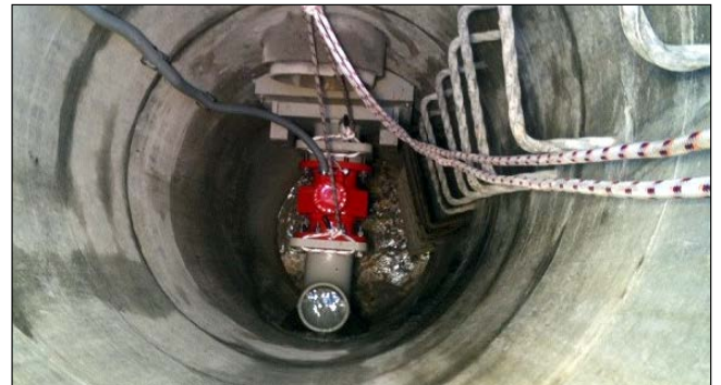
Messstelle 2 am Südportal, Stationäre Durchflussmessung Nennweite 150

Via GSM/GPRS Netz werden die Messdaten über Internet im ARAbella online-Portal aufgezeichnet und kundenspezifisch dargestellt.