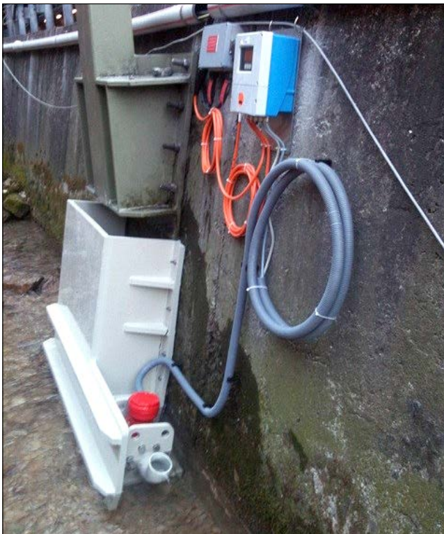
Messstelle 3 am Nordportal, Stationäre Durchflussmessung Nennweite 100

Zur Erhebung präziser Hydro-Messdaten als Grundlage für den Ausbau des Belchentunnels setzt das Bundesamt für Strassen (ASTRA) sowohl für die Messtechnik wie auch für die Datenübermittlung und das Monitoring auf STEBATEC.