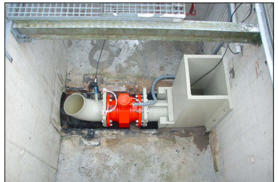
In sich kalibrierte stationäre Durchflussmessung NW 200 mit integrierter pH- und Trübungsmessung