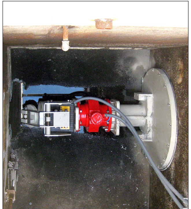
nachher Pneumatische Abflussregelung Nennweite 200