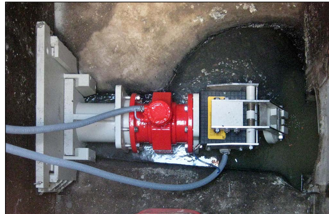
nachher Pneumatische Abflussregelung NW 200 mit zweiteiliger Montageadaption