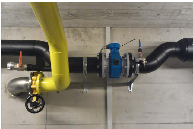
Stationäre Durchflussmessung NW 150 eingebaut im Auslauf der Kanalisation.